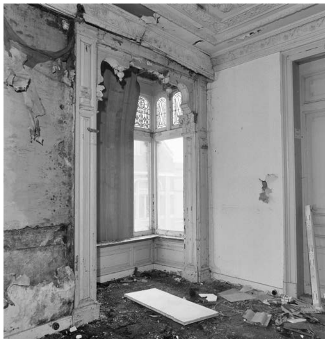
Ruïneuze staat van de erker aan Blijhamsterstraat 13-13A in Winschoten. A.J. van der Wal 1992

Vanwege de fijne detaillering en kwetsbaarheid is het zaak behoedzaam te opereren bij restauratie, vooral als er veel herstelwerk nodig is. Bij houten onderdelen is een aannemer of timmerman geneigd meer te vervangen dan echt nodig is. Een argument als het is goedkoper om het geheel te vervangen botst met de wens om cultuurhistorische waarden zo veel mogelijk te behouden. Bij een geslaagde restauratie is alleen datgene vervangen wat écht nodig was. Een tweede valkuil is dat men het geheel beter wil uitvoeren dan het ooit is geweest. Het gaat dan niet over kleine toevoegingen van bijvoorbeeld wat extra lood of zink om de vochtafvoer te bevorderen. De Rijksdienst adviseert om de detaillering zo trouw mogelijk te volgen, zodat het oude karakter van de erker optimaal bewaard blijft.